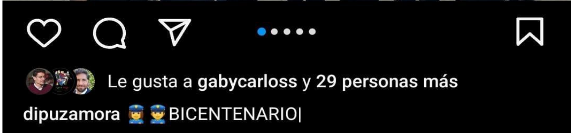
Publicación Instagram institucional Diputación de Zamora 13-01-2024