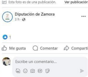
Publicación FaceBook institucional Diputación de Zamora 13-01-2024